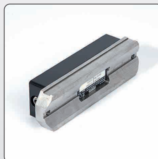
Прецизионное призматическое основание, изготовленное из закаленной стали.