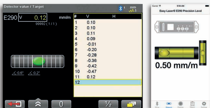
Цифровое и графическое представление данных на блоке индикации Easy-Laser® и смартфоне iPhone.

Использование отдельного блока индикации (приобретается отдельно) еще больше упрощает процесс работы, поскольку у вас есть возможность считывать данные и следить за процессом регулировки в определенной точке на машине, в которой и осуществляется регулировка. Результаты измерений можно документировать и передавать на ПК для дальнейшего составления протокола измерений. Разработано бесплатное приложение для iPhone, iPad, и iPod touch, в котором отображаются результаты измерений в режиме реального времени, а также предусмотрена возможность документирования данных.