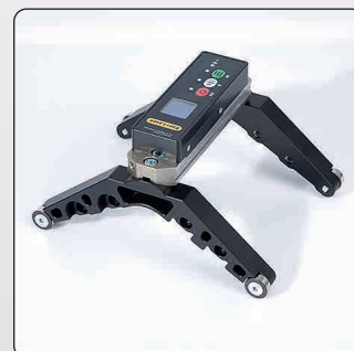
Дополнительные принадлежности для валков диаметром 55–800 мм. Номер по каталогу 12-0901.

Система Easy-Laser® изготовлена компанией Easy-Laser AB, Alfagatan 6, SE-431 49 Molndal, Sweden (Швеция). Тел.: +46 31 708 63 00. Факс: +46 31 708 63 50. Эл. почта: info@easylaser.com. Веб-сайт: www.easylaser.com. © Easy-Laser AB, 2020. Мы сохраняем за собой право вносить изменения без предварительного уведомления. Easy-Laser® является зарегистрированным товарным знаком компании Easy-Laser AB. Apple, логотип Apple, iPhone и iPod touch являются товарными знаками компании Apple Inc., зарегистрированными в США и других странах. App Store является знаком обслуживания компании Apple Inc. Прочие товарные знаки принадлежат соответствующим владельцам. Данное изделие соответствует следующим стандартам: EN60825-1, 21 CFR 1040.10 и 1040.11. Содержит идентификатор Федеральной комиссии связи США: RVN0946, IC: 5325A-0946. Идентификатор документа: 05-0893, ред. 4